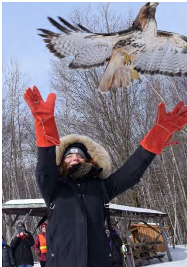
Buse à queue rousse

Voici quelques images de la première fin de semaine de nos Journées blanches. Les remises en liberté d'oiseaux de proie réhabilités sont très appréciées à en croire les commentaires sur notre page facebook.