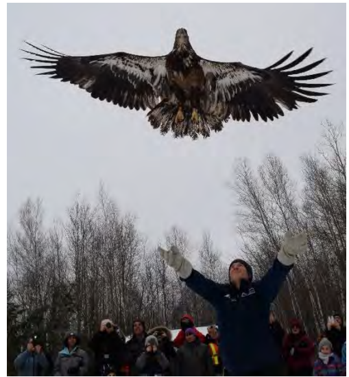
Jeune pygargue à tête blanche