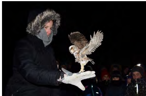
Petite nyctale relâchée pendant le safari nocturne.